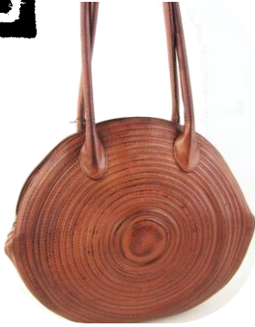
Col. Cannella ¥115,000