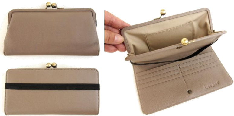
#LIZ 13-023 (W19xH10)