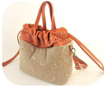
Col. 現物のみ ¥30,000