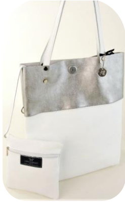
--- Col. Bronze/Black, Silver/White, Bronze/Grey 他 --- ¥19,000