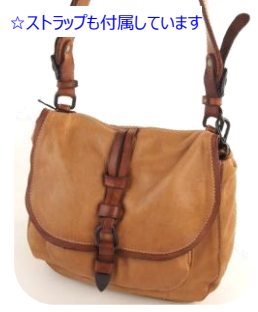
☆ストラップも付属しています