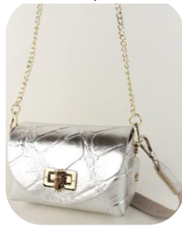
Col. Silver, Gold ¥17,000