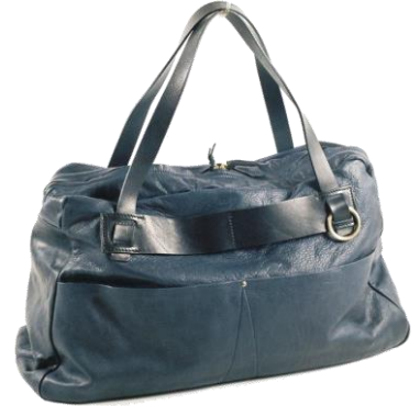
Col. BLK, DBR, トープ, ブルー, グレー ¥63,000