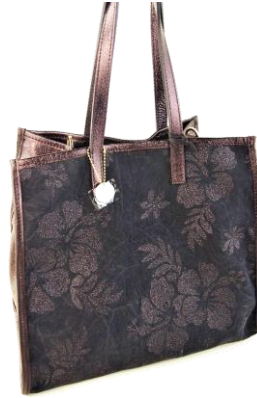
--- Col. Black, Green --- ¥24,000