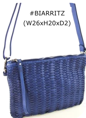
----- Col. Blue, Tabacco, Green ----- ¥22,000