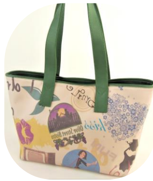
Col. Lattuga(Green) (牛革部分) ¥25,000