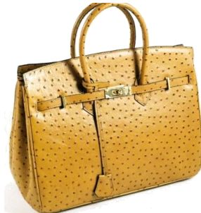
Col. BK, DBR, CM, GRN, OR, 外ハシ ¥27,000 / ¥24,000