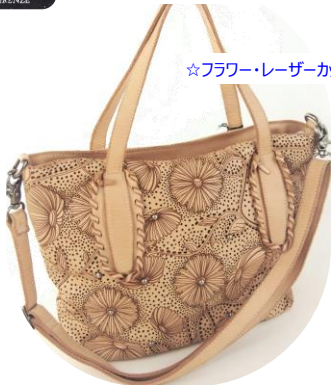
☆フラワー・レーザーカットワーク