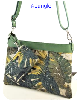
Col. 現物のみ ¥25,000