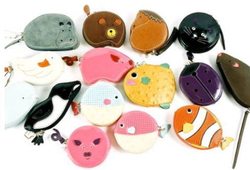
#1818 (アニマルゼニール)