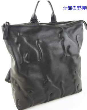
Col. Blk, Piogia (Blue), Gesso(Off WH), Taupe ¥43,000