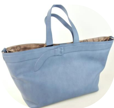
Col. Pioggia (Blue) ¥40,000