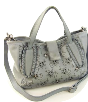
Col. 現物のみ ¥34,000