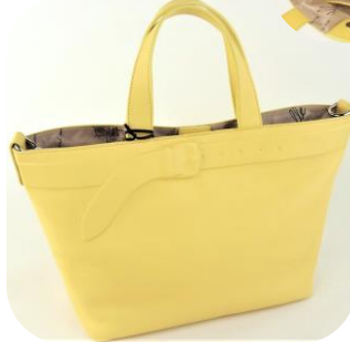
Col. Cedro (Yellow) ¥33,000