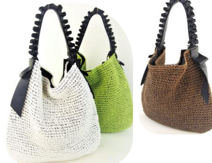
Col. Apple, White, natural, Brown, Rose ¥16,500