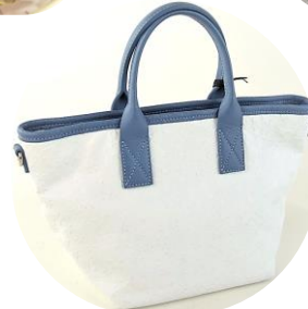
Col. 現物のみ ¥26,000