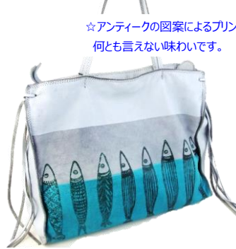
☆アンティークの図案によるプリントが何とも言えない味わいです。