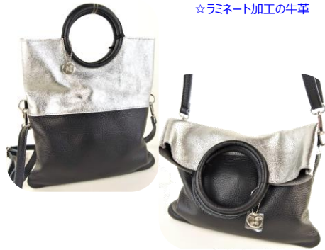
☆ラミネート加工の牛革