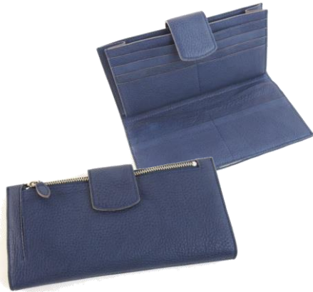
#LIZ 13-022 (W19.5xH10)

☆手触りのよいタンニンなめしの上質な牛革を使用したナチュラル・シュリンクレザーのお財布とポシェット