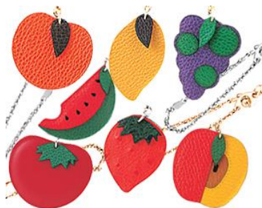
#1717 (フルーツチェーン)

☆小銭や小物入れとしてお使い頂けます。中にキーリングが付いています。サイズ 8~10cm x 6~8cm 程度です。