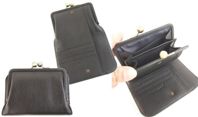
#LIZ 13-026 (W14xH10)