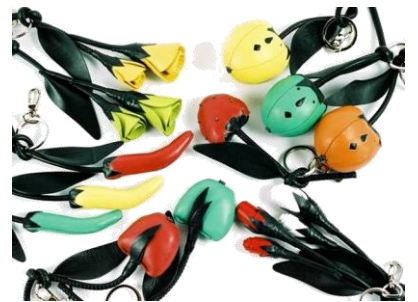
#ぬいぐるみ キーリング各種