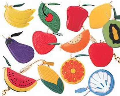
#1616 (フルーツゼニール)