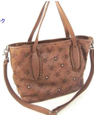
Col. 現物のみ ¥38,000