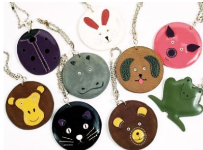
#1919 (アニマルチェーン)