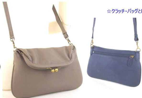
#LIZ 13-025 (W26xH16)