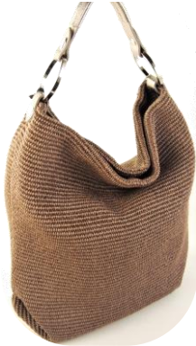
----- Col. (Rafia/Calf) Natural/Bronze, Cuoio/Bronze, Terra, Black, Blue ----- ¥22,000