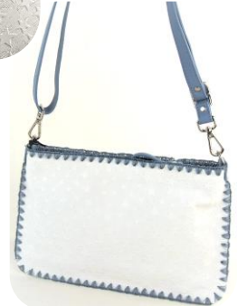
Col. 現物のみ ¥26,000