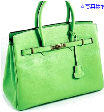
#11-876M ☆手頃なMサイズ (W35xH27xD16)

☆幅広いカラーからお選び頂けます。カラーチャートは弊社HP ( www.yagicho.com ) プログ内【八木長の商品】サイドメニューからご覧頂けます。