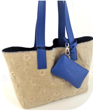
Col. China(Blue), Orange (牛革部)