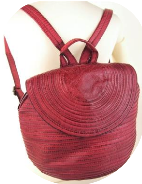
Col. Lacca (Red) ¥93,000