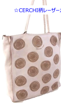
☆CERCHI柄レーザーカット