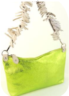
Col. Apple, Blue, Silver ¥22,000