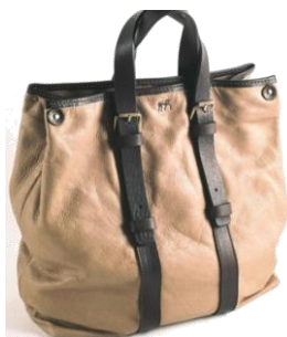
Col. DBR, トープ, グレー ¥53,000