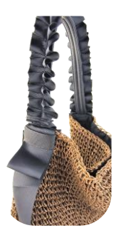
☆リボン素材の持ち手が可愛い!