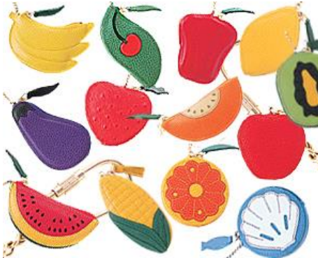
#1616 (フルーツセニール)

☆小銭や小物入れとしてお使い頂けます。中にキーリングが付いています。サイズ 8~10cm x 6~8cm 程度です。