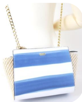
---- Col. White (Capri) ---- ¥22,000