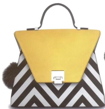
Col. Optical ¥43,000