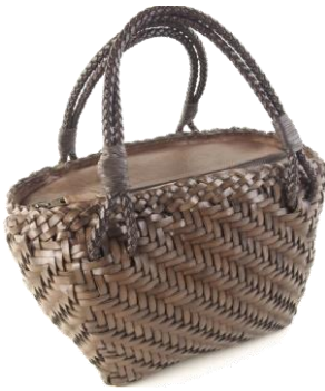
Col. Fango, Cuoio ¥85,000