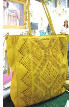
Col. Blue, Military ¥57,000