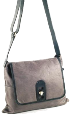
----- Col. BLK, DBR, トープ, ブルー, グレー ----- ¥47,000