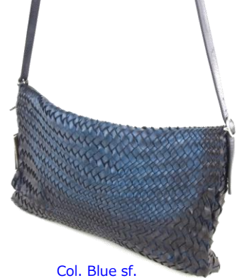
Col. Blue sf. ¥100,000