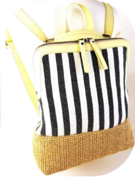
Col. Raffia/Red ¥34,000