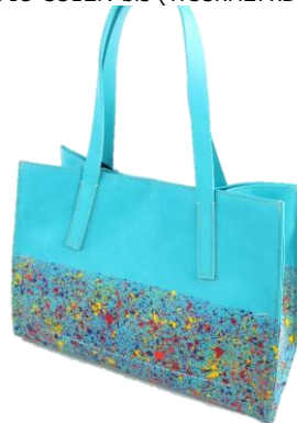
Col. Panna/Orange, Blue ¥35,000