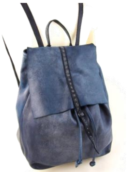
Col. Blue, Military ¥63,000