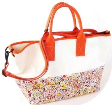
Col. Panna/Orange ¥35,000