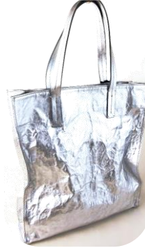
Col. Silver ¥41,000