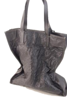
Col. Black ¥40,000