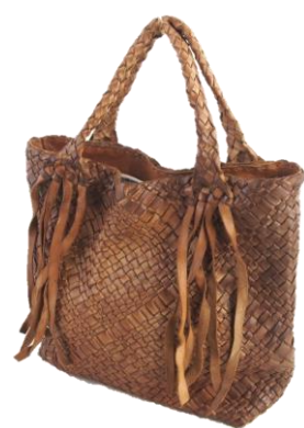
Col. Castagna Sf. ¥105,000