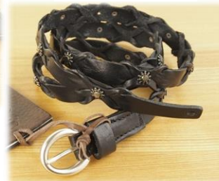
Size 85, 90cm ¥21,000