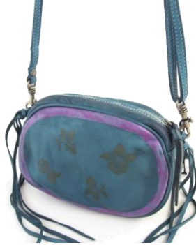
Col. Corda/Beige, Grey ¥33,000