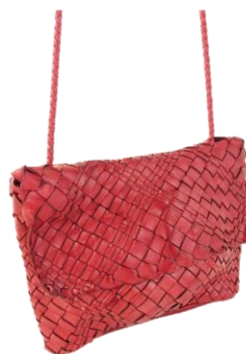
Col. Rosso ¥65,000