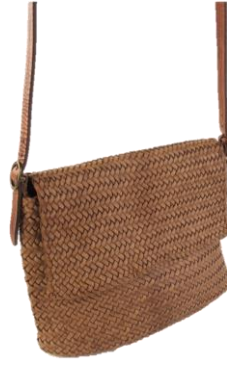
Col. Cuoio ¥75,000