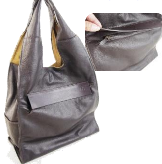
Col. ブラック, DBR ¥49,000