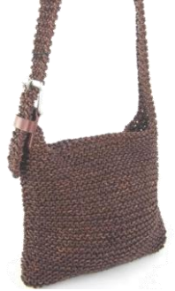
Col. Papaya ¥45,000