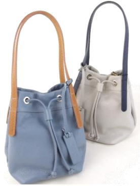
---- Col. Grey, Blue (牛革) (上記2型共通) ---- ¥23,000