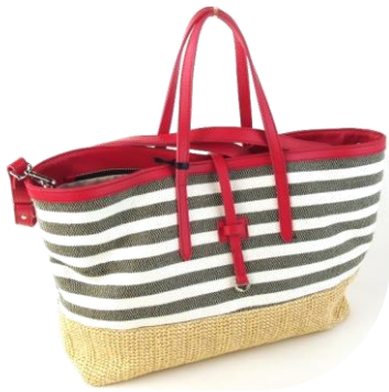
Col. Raffia/Red ¥32,000