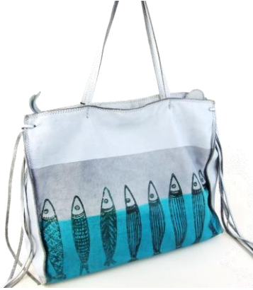
Col. Corda/Beige (牛革) ¥61,000