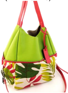
---- Col. Lt.Green (Figi Print canvas) (上記3型共通) ---- ¥30,000