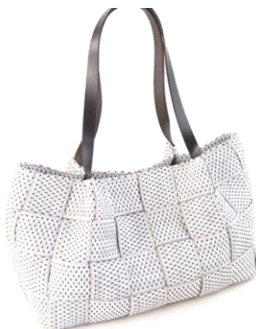
Col. White, Blue, Yellow, Orange, Navy, Black (大小2型) ¥12,000