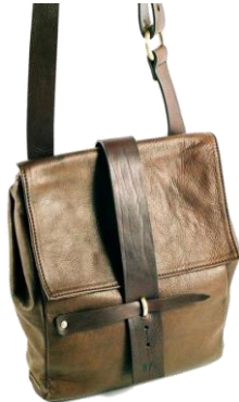
Col. ブラック, ブラウン, ブルー ¥46,000