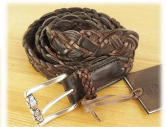
Size 85, 90cm ¥19,000