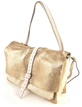
Col. Blue, Military ¥47,000