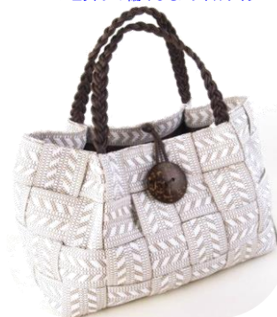
Col. White, Black, Navy, D.BR, Toast ¥14,000