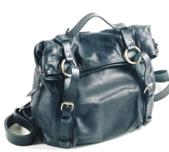
Col. ブラック, DBR, トープ, ブルー ¥59,000