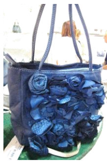
Col. Blue ¥73,000