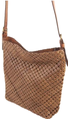
Col. Cuoio ¥115,000