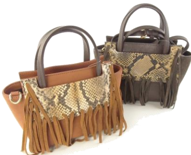
---- Col. Camel, Dk.BR (上記3型共通) ---- ¥35,000