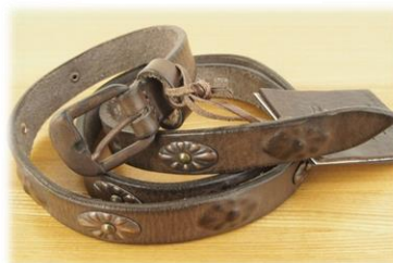
Size 85, 90cm ¥19,000