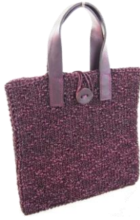
Col. Pomerol ¥40,000