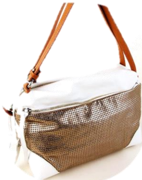
--- Col. White/Silver, White/Bronze (#2745のみ) --- ¥33,000