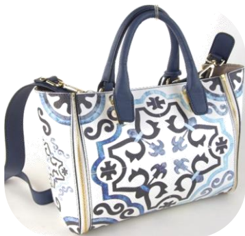
Col. Marino (Taormina) ¥38,000