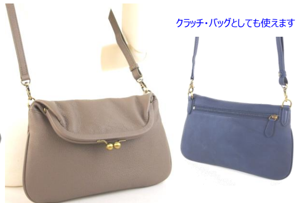
#LIZ 13-025 (W26xH16)