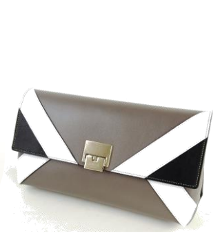
Col. Ruby, Beige(White), Marverick(Grey) ¥35,000