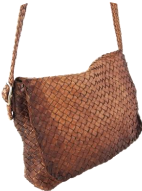
Col. Castagna Sf. ¥100,000