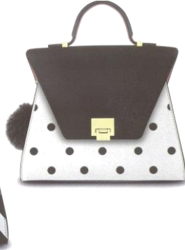
Col. Pois ¥43,000