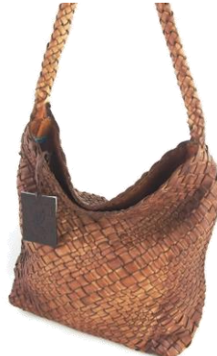
Col. Castagna Sf. ¥105,000