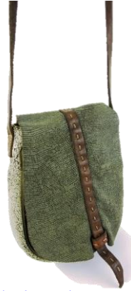
Col. Blue, Military, Grey ¥35,000