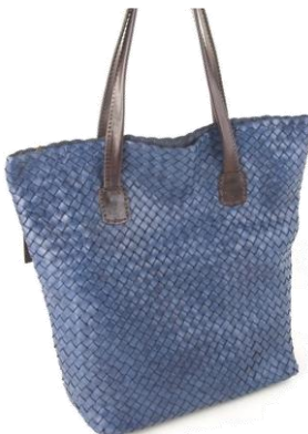
Col. Blue Scuro ¥120,000