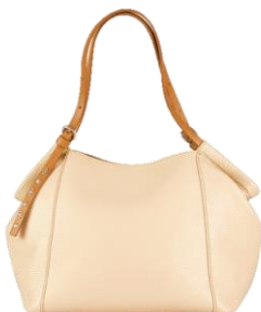
----- Col. White, Orange, Blue (上記2型共通) ----- ¥32,000