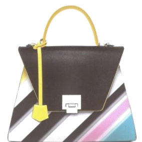
Col. Rainbow ¥45,000