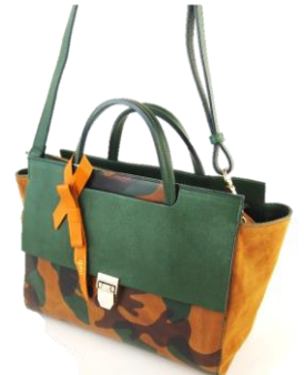
-- Col. Camouflage -- ¥36,000⇒ ¥23,000