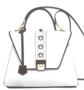
Col. Wite ¥45,000